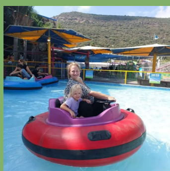
סוכות: יום כיף בקיפצובה ובפארק בלאגן