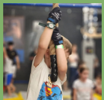
יולי: יום הנינג'ה בכפר סבא, מודיעין וחיפה