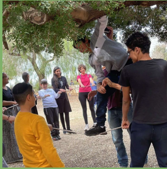
פורים: אירוע נוער חוויתי

לחצו על התמונות לקבלת מידע נוסף וגלריית תמונות.