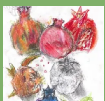
ראש השנה: תחרות עיצוב ברכות אונליין