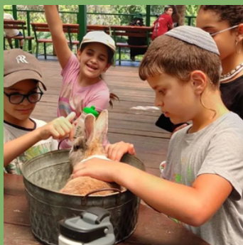
יולי: יום כיף בפארק אוטופיה