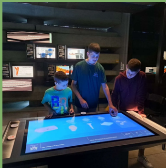
ל"ג בעומר: פעילות לנוער במרכז פרס לחדשנות