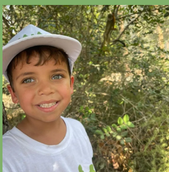
אוגוסט: יום כיף בפארק הקופים