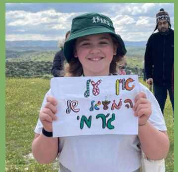
פסח: יום כיף בבית גוברין ובאגמון החולה